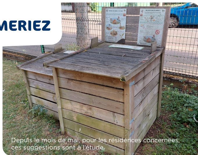
Depuis le mois de mai, pour les résidences concernées, ces suggestions sont à l'étude.

En revanche, dans les équipements, l'installation de composteurs, d'aires de jeux ou de bancs peuvent être de