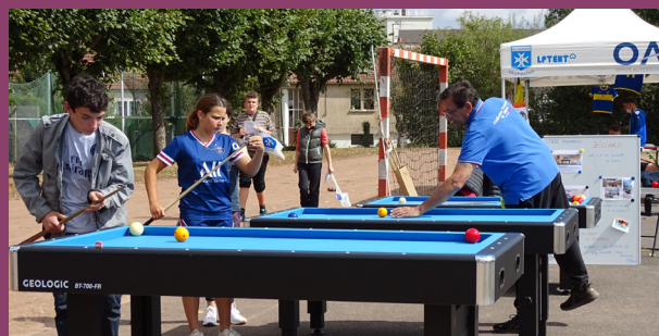
L'initiation au billard avec le Stade Auxerrois a fait des émules chez les plus jeunes.