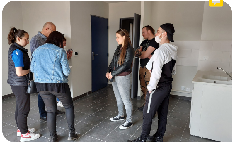
Près de 270 visites ont été enregistrées lors de la journée portes ouvertes de nos deux résidences Porte de Paris et Gembloux.

Suite à ces visites, des demandes sont parvenues au Service Logement de l'OAH. Courant mai, les travaux de ces deux résidences ont été réceptionnés et la Commission d'attribution des logements a commencé à répartir les demandes. La résidence Porte de Paris dispose de 50 logements et Gembloux, 18 logements. Les premiers emménagements devraient intervenir dans le courant de l'été.